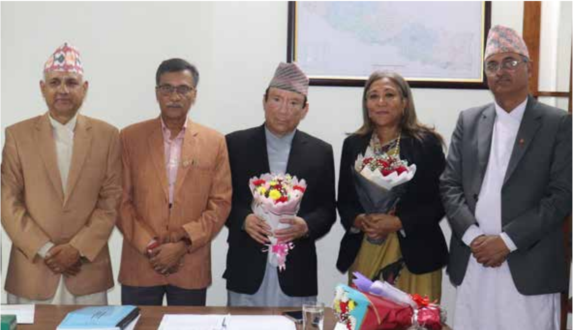
सम्माननीय प्रधान न्यायाधीश एवम् न्याय परिषदका अध्यक्ष श्री प्रकाशमानसिंह राउतको साथमा न्याय सेवा आयोगका पदाधिकारीहरू।