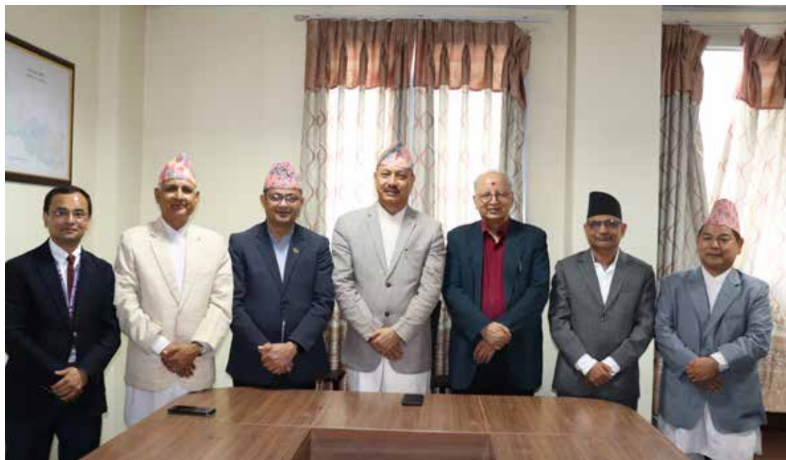
निवर्तमान सम्माननीय प्रधान न्यायाधीश एवम् न्याय परिषदका अध्यक्ष श्री विश्वम्भरप्रसाद श्रेष्ठको साथमा न्याय सेवा आयोगका पदाधिकारीहरू।