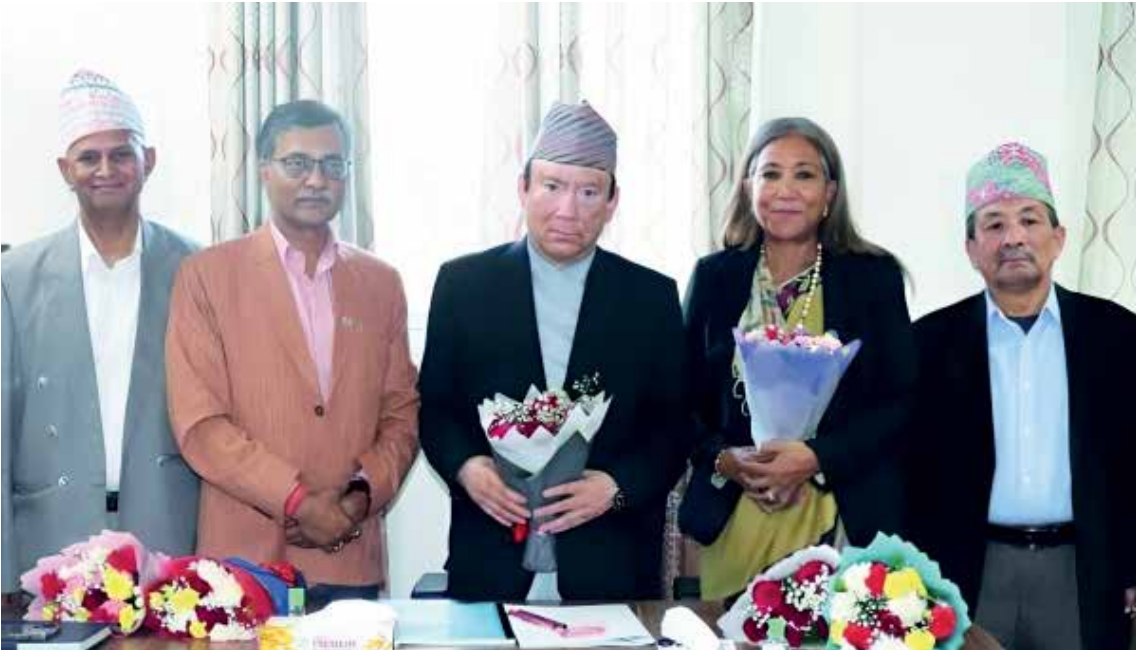
सम्माननीय प्रधान न्यायाधीश एवम् न्याय परिषदका अध्यक्ष श्री प्रकाशमानसिंह राउतको साथमा न्याय परिषदका पदाधिकारीहरू।