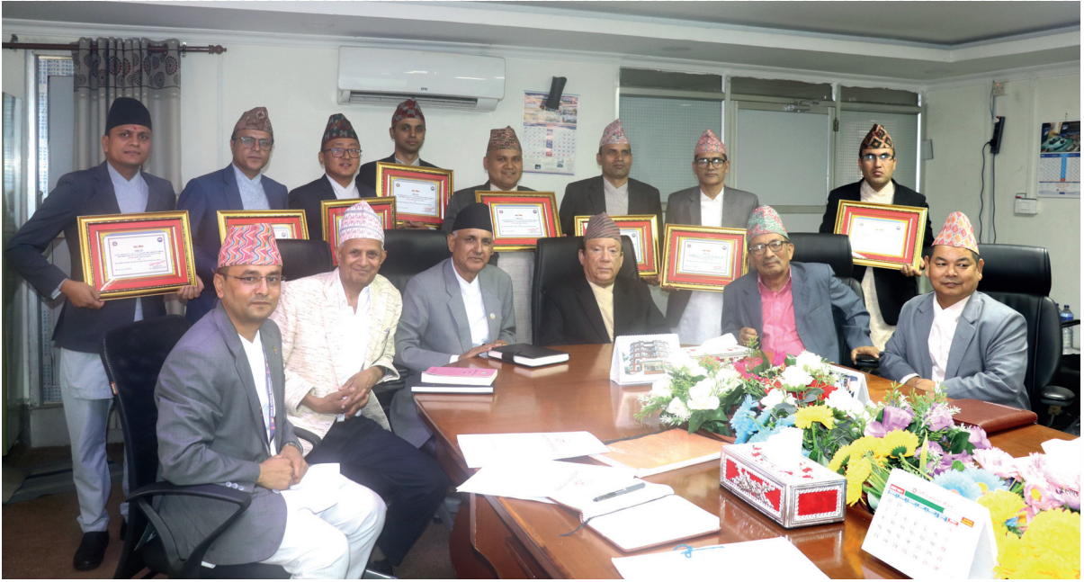
नवनियुक्त जिल्ला न्यायाधीशहरूको अभिमुखिकरण तालिममा प्रमाणपत्र वितरणपछि, लिइएको तस्बिर ।