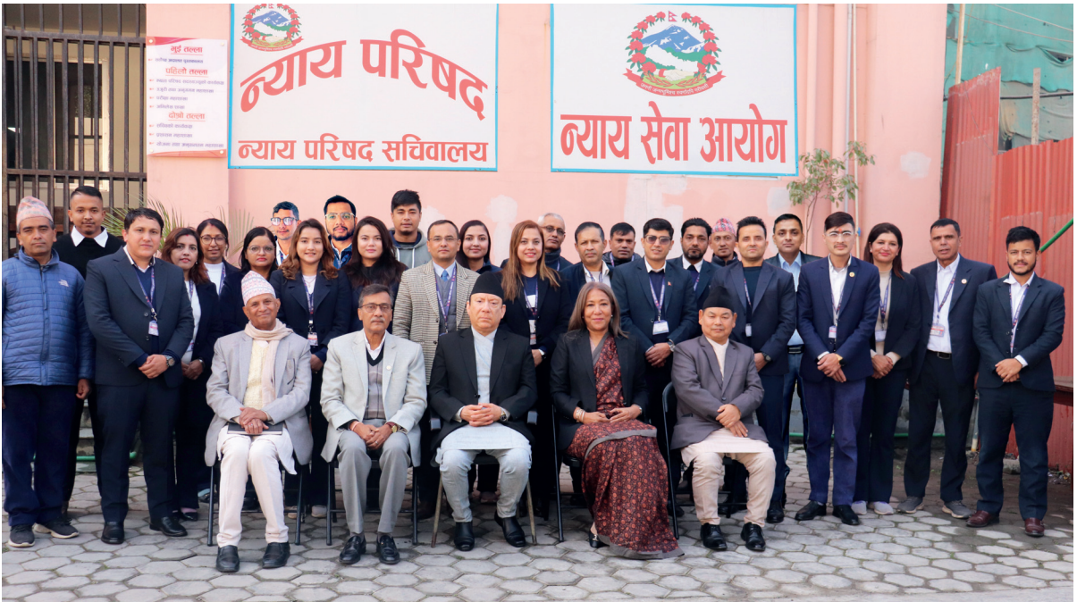
सम्माननीय प्रधान न्यायाधीश एवम् न्याय परिषदका अध्यक्ष श्री प्रकाशमानसिंह राउतको साथमा न्याय परिषदका पदाधिकारीहरू, सचिव एवम् सचिवालयमा कार्यरत कर्मचारीहरूको सामूहिक तस्बिर ।